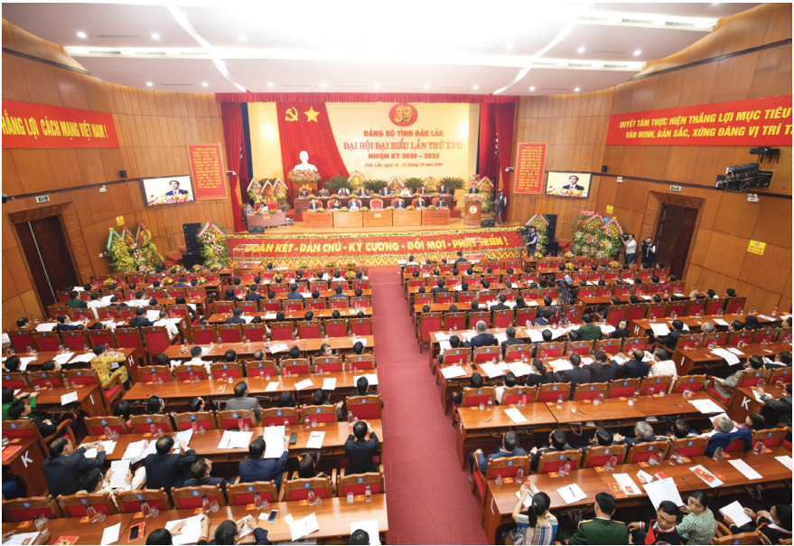
Đại hội đại biểu Đảng bộ tỉnh Đắk Lắk lần thứ XVII, nhiệm kỳ 2020 - 2025.