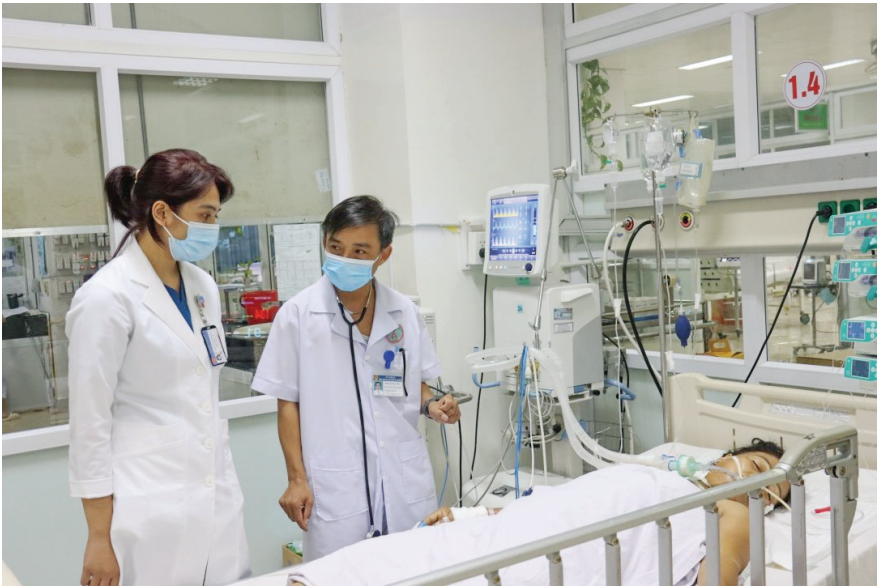
Chăm sóc sức khỏe nhân dân tại Bệnh viện Đa khoa Vùng Tây Nguyên.