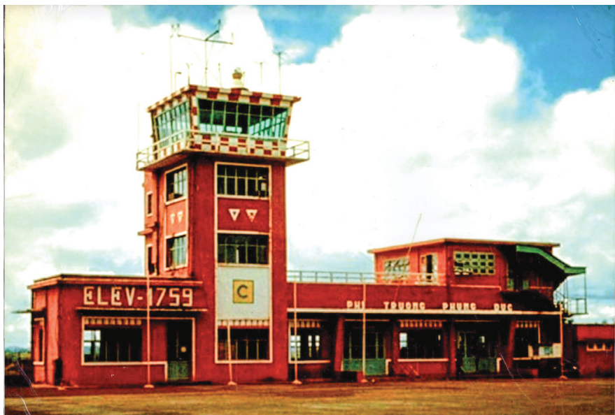
Phi trường Phụng Dục (sân bay L19) tại thị xã Buôn Ma Thuột năm 1961.