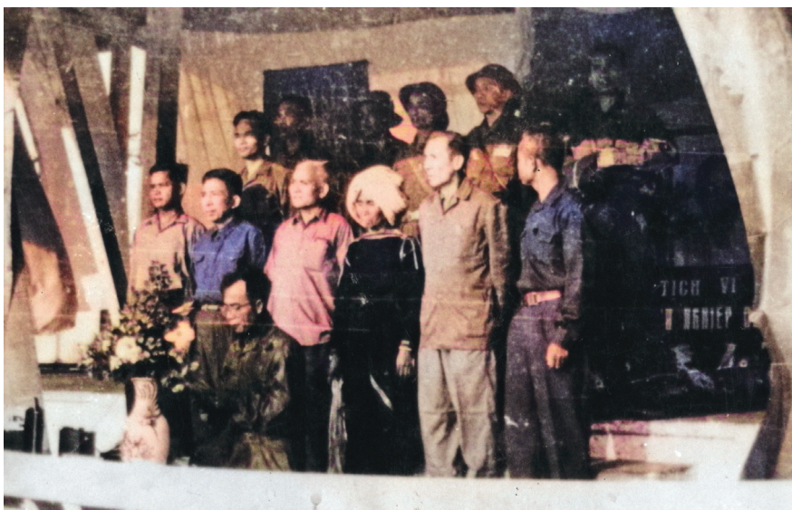
Lễ ra mắt Ủy ban Quân quản Đắk Lắk ra mắt tại Đình Lạc Giao, ngày 18/3/1975.