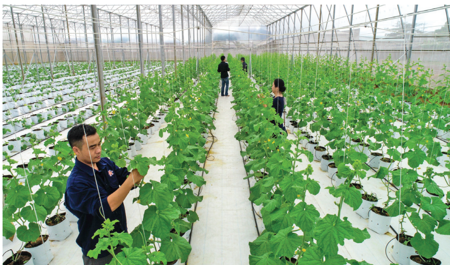
Mô hình trồng dưa lưới công nghệ cao tại thành phố Buôn Ma Thuột.