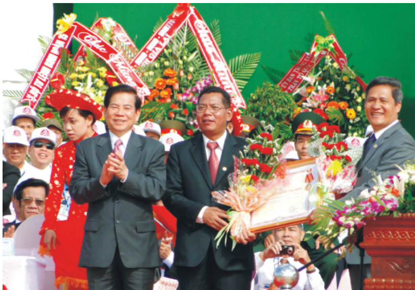
Đồng chí Nguyễn Minh Triết, Ủy viên Bộ Chính trị, Chủ tịch nước trao tặng Huân chương Hồ Chí Minh cho Đảng bộ và các dân tộc tỉnh Đắk Lắk tại Lễ kỷ niệm 35 năm chiến thắng Buôn Ma Thuột giải phóng tỉnh Đắk Lắk (10/3/1975 - 10/3/2010).