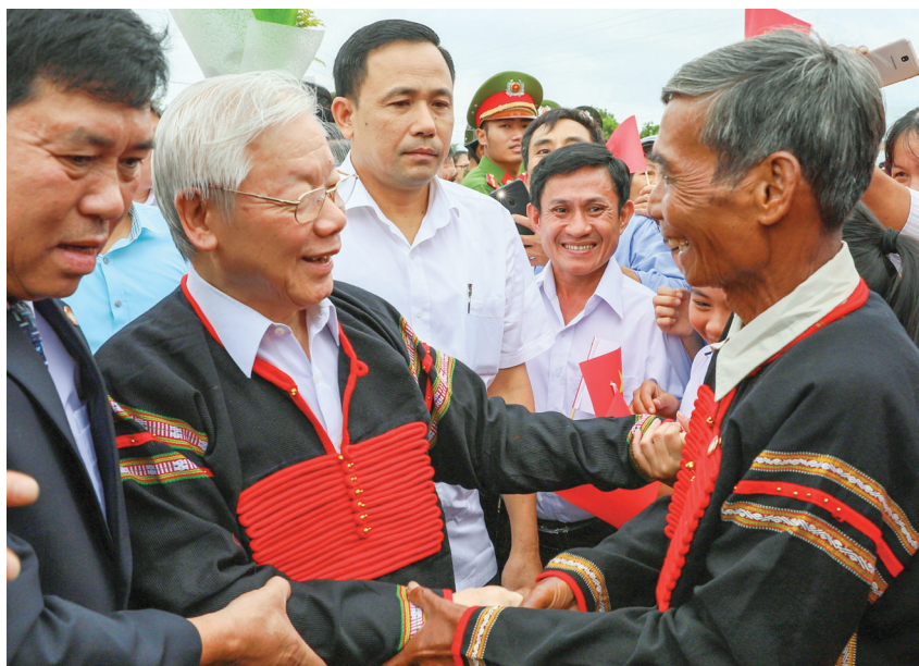
Tổng Bí thư Nguyễn Phú Trọng thăm hỏi nhân dân xã Dur Kmăl, huyện Krông Ana tại Ngày hội Đại đoàn kết toàn dân tộc năm 2018.