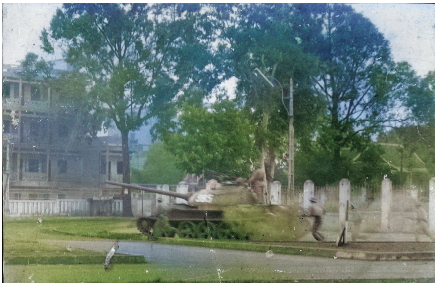
Đánh chiếm Ngã Sáu thị xã Buôn Ma Thuột trong chiến dịch Xuân 1975.