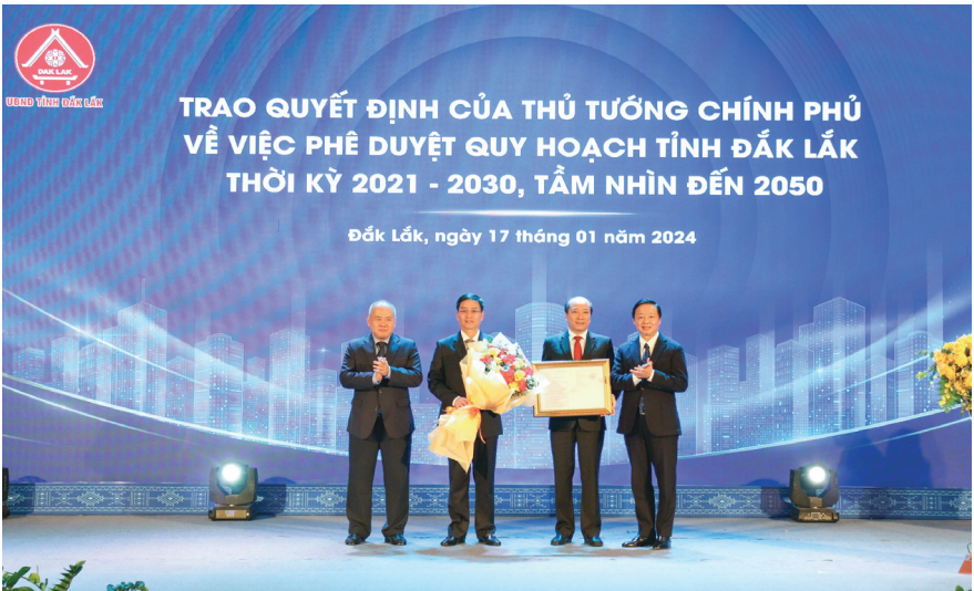
Hội nghị công bố Quy hoạch tỉnh Đắk Lắk thời kỳ 2021 - 2030, tầm nhìn đến năm 2050.