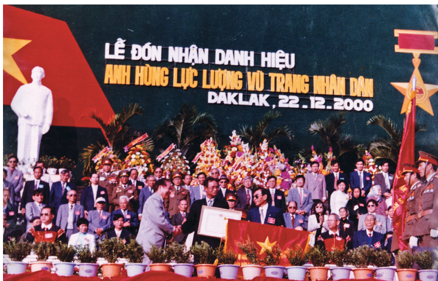
Tỉnh Đắk Lắk vinh dự đón nhận danh hiệu Anh hùng Lực lượng vũ trang nhân dân - năm 2000. Ảnh: TL. Bảo tàng Đắk Lắk