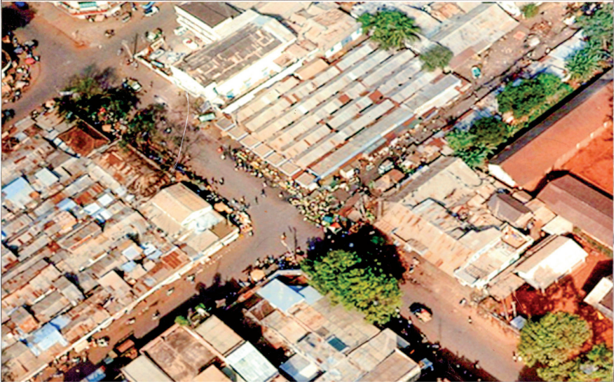
Một góc thị xã Buôn Ma Thuột năm 1965.