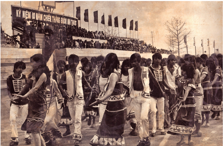
Đoàn diễu hành trong lễ kỷ niệm 10 năm chiến thắng Buôn Ma Thuột 10/3/1975 - 10/3/1986.