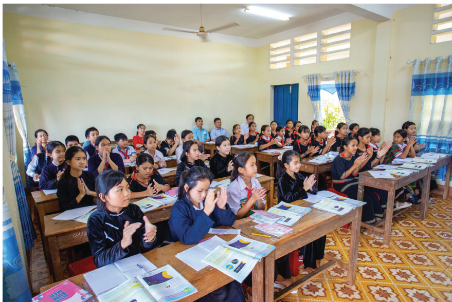
Thi đua dạy tốt, học tốt ở huyện Krông Năng.