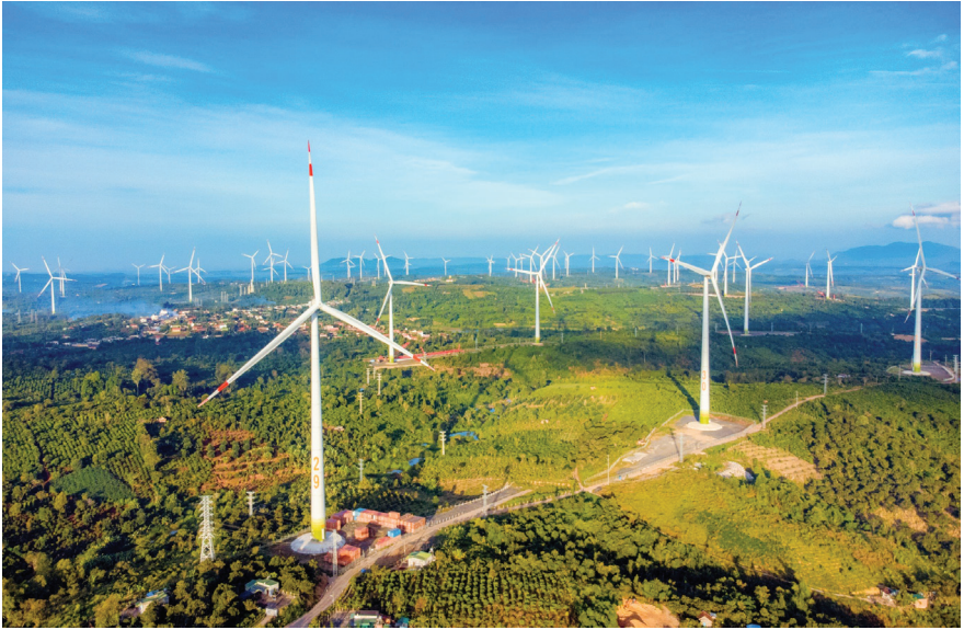
Cánh đồng điện gió ở xã Ea Nam, huyện Ea H'Leo.