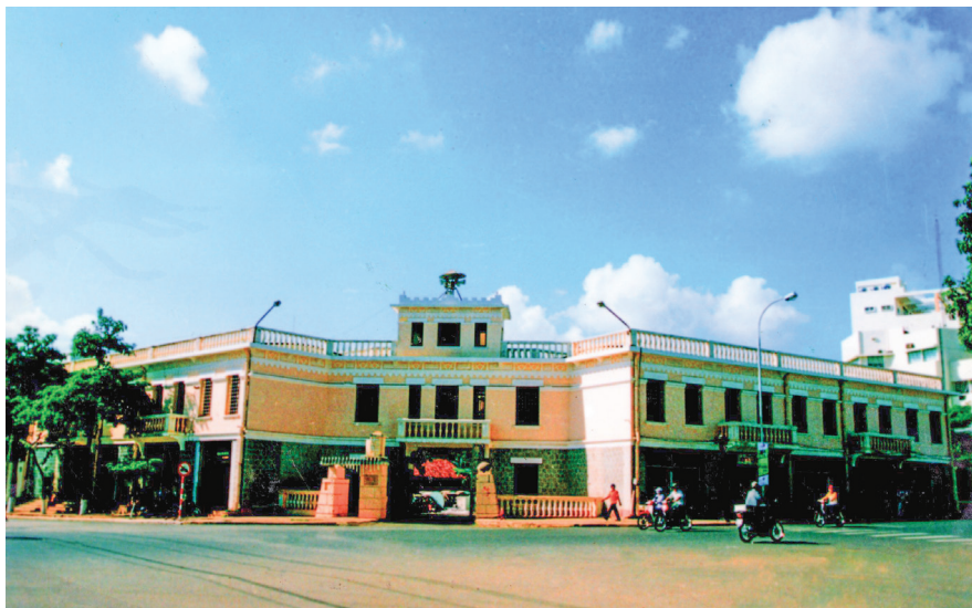
Nhà đèn Buốc-gơ-ri của Pháp (nay là Điện lực Đắk Lắk).