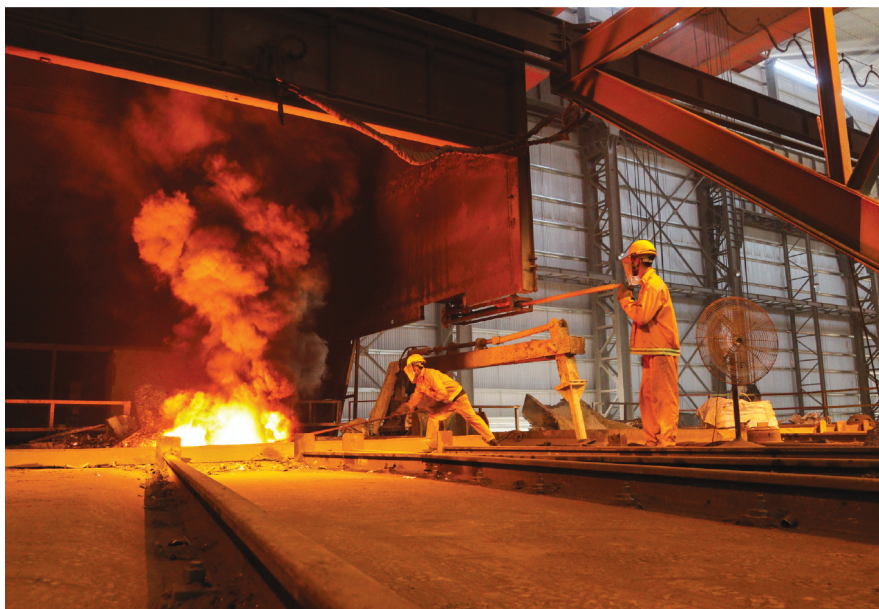
Sản xuất thép ở Công ty Cổ phần Thép ASEAN (KCN Hòa Phú).