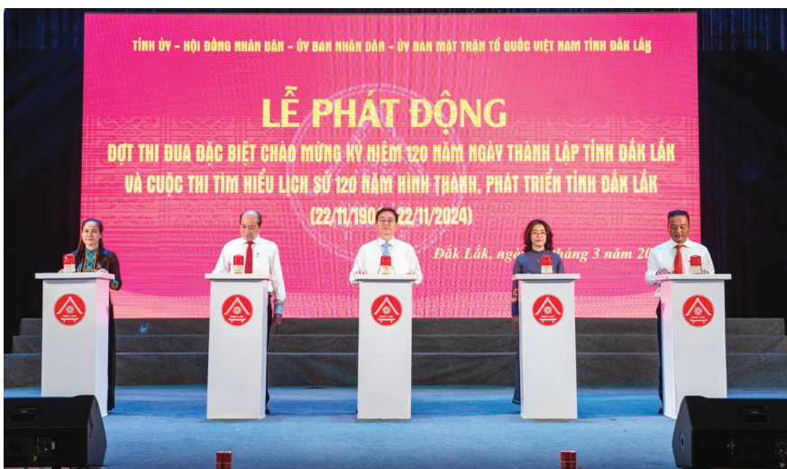
Lễ phát động đợt thi đua đặc biệt chào mừng kỷ niệm 120 năm Ngày thành lập tỉnh Đắk Lắk (22/11/1904-22/11/2024), với chủ đề “Khát vọng xây dựng tỉnh Đắk Lắk giàu đẹp, văn minh, bản sắc” và Cuộc thi tìm hiểu “120 năm lịch sử hình thành và phát triển tỉnh Đắk Lắk”.