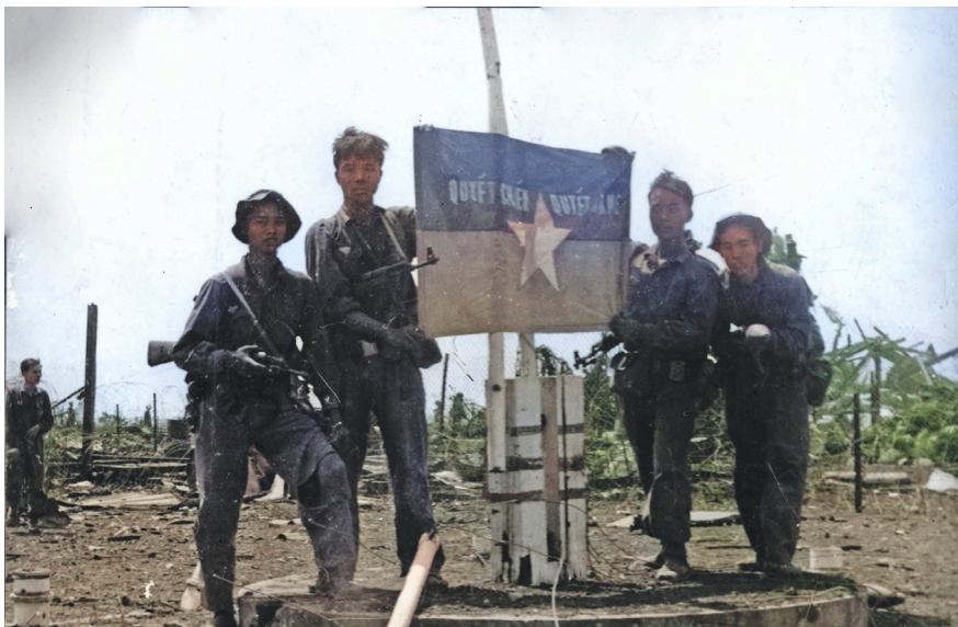
Bộ đội ta giương cao cờ quyết chiến, quyết thắng tại khu Mai Hắc Đế, kết thúc chiến dịch giải phóng Buôn Ma Thuột (11/3/1975).