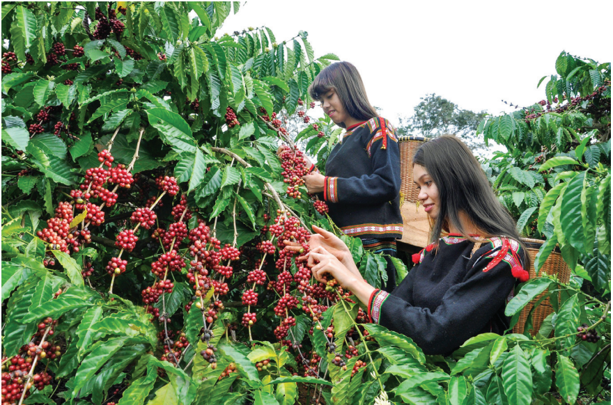
Mùa thu hoạch.