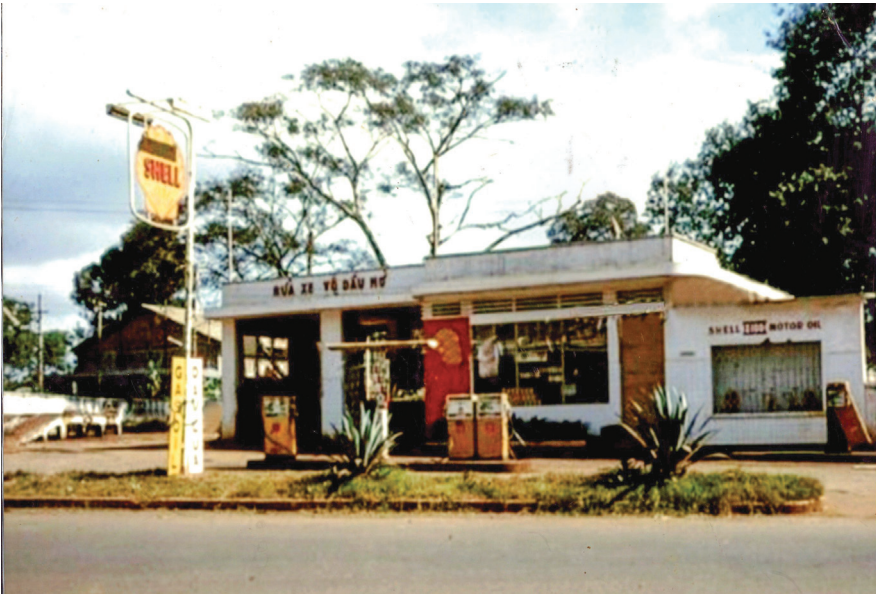
Khu trung tâm Buôn Ma Thuột năm 1965 (nay là Ngã Sáu - thành phố Buôn Ma Thuột).