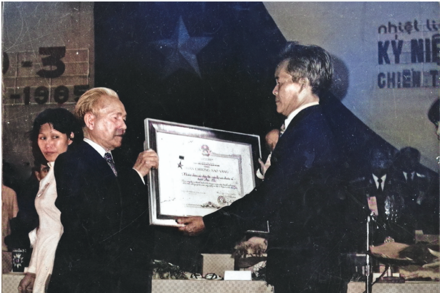
Tỉnh Đắk Lắk vinh dự đón nhận Huân chương Sao Vàng - năm 1985.