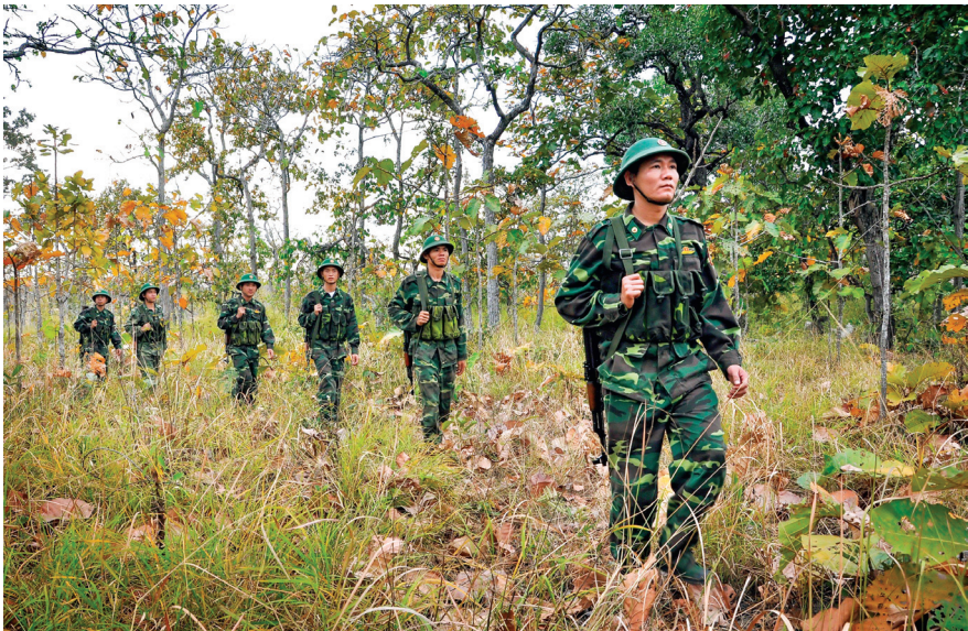
Giữ gìn bình yên biên giới.