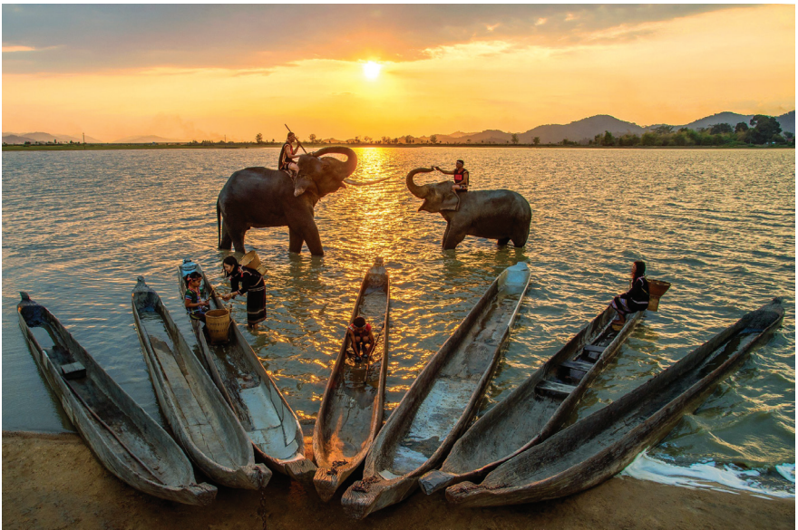
Hoàng hôn trên Hồ Lắk.