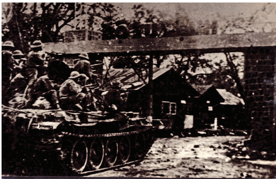
Xe tăng và bộ đội ta đánh chiếm sư bộ 23 - Cơ quan đầu não của ngụy ở Đắk Lắk.