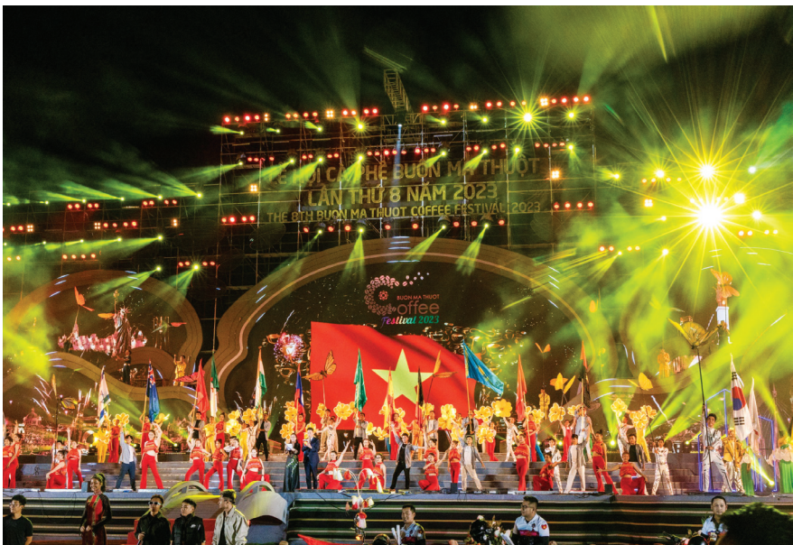
Lễ hội Cà phê Buôn Ma Thuột lần thứ 8 năm 2023.