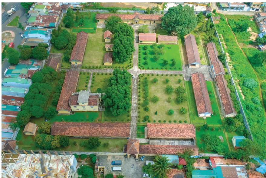
Di tích lịch sử quốc gia đặc biệt Nhà đày Buôn Ma Thuột.