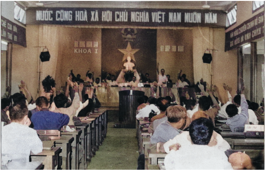
Kỳ họp thứ nhất, Hội đồng nhân dân khóa I nhất trí thông qua các nghị quyết để phát triển KT-VH của tỉnh trong 5 năm 1976 - 1980.