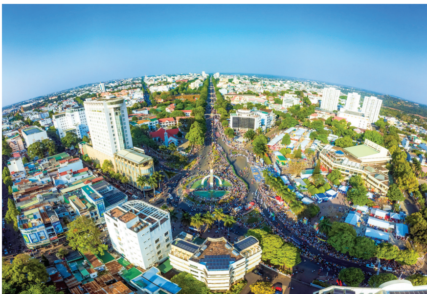
Ngã Sáu Buôn Ma Thuột.